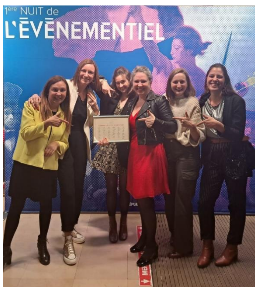
L'équipe événementiel du Château des Pères

Ce trophée est une belle récompense pour la famille Legendre qui met son audace au service du développement de ce Domaine depuis son rachat en 2011. C'est aussi une belle reconnaissance pour toutes les personnes qui se sont investies dans la construction de ce projet, pour tous les clients et partenaires qui ont permis le développement de ce site hors du commun et pour tous les collaborateurs qui le font vivre au quotidien !